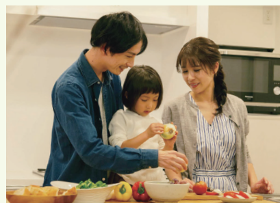
余った電気は 蓄電池 にためて HEMSでかしこく使う