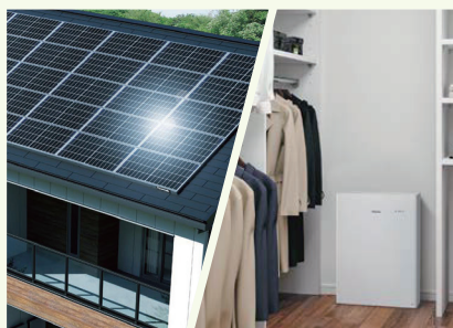
お客様負担 0円 で太陽光 9.4kW と 蓄電池 3.5kWh を設置します