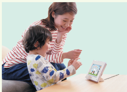
11年目からは 売電収入 も得られます