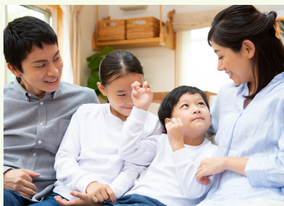
16年目以降は太陽光発電システムと 蓄電池を 無償譲渡 いたします