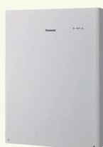
Panasonic 蓄電池 3.5kWh 余った電気は蓄電池に貯めて HEMS (AiSEG3) でかしこく使う