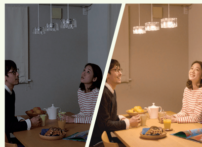
万が一の 停電 でも 蓄電池 で 日常の電気が使えるので 安心

※エネ得放題プラスは、オネスティーハウス石田屋のスマートタウン寄居花園分譲地内で新築住宅をご契約された方が対象となります。太陽光発電パネルで発電した電気のみが使い放題です。ジャックスローンの審査が入ります。天候不良や周辺環境などの諸条件で発電できなかった場合は別途電気代が発生します。蓄電池の増設、V2Hの設置などはお支払金額が変わります。 ※太陽光の設置容量9.4kW、太陽光発電でまかなう電気量を平均377kWh/1ヶ月（自家消費分・蓄電池分）の場合、東京電力スマートライフプラン（2025年8月度）の弊社データシミュレーションです。※燃料調整費は含まれておりません。詳しくはお問い合わせください。